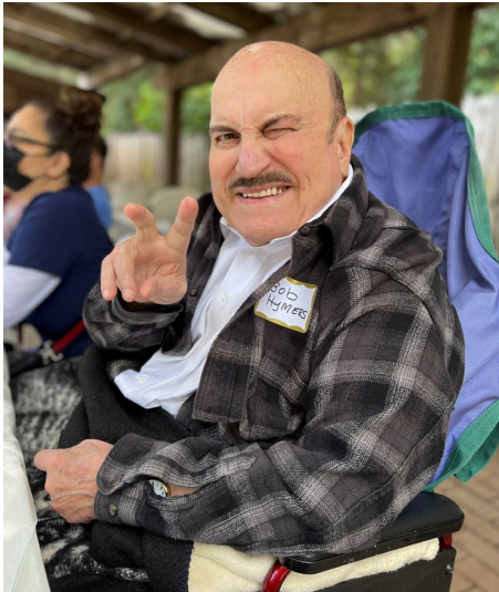
Men m ap bay siy V-pou-viktwa nan reyinyon 50yèm anivèsè Legliz Pòt Ouvè a!

Nan tan Nwèl sa a mwen priye, “Ann di Bondye mèsi pou gwo kado sa a li ban nou, yon kado ki pa gen parèy.” Epi se pou w pase yon bèl moman pandan w ap selebre kado envizib Bondye (II Korentyen 9:15) nan voye Pitit li a fèt ak mouri pou nou!