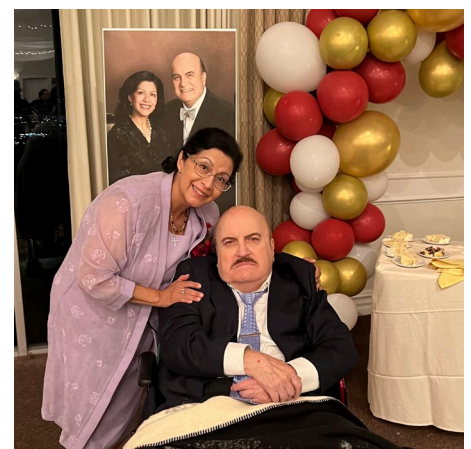
Ileana ak mwen nan our 40yèm selebrasyon anivèsè nesans nou an, devan potrè 25yèm anivèsè nou an.

OU KA LI DÈ SANTÈN NAN LESON AK MESAJ MO-POU-MO NOU YO NAN KARANN SIS LANG NAN WWW.SERMONSFORTHEWORLD.COM.